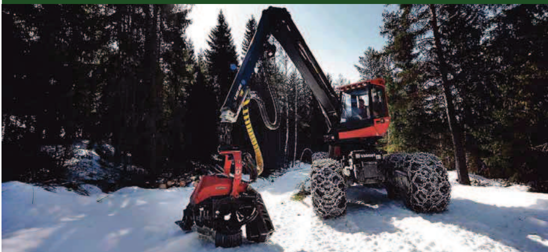
Hogst: Et organisert system for skogkoordinator-stillinger bøter på utfordringene med eiendomsstrukturen i skogen, skriver kronikkforfatteren.