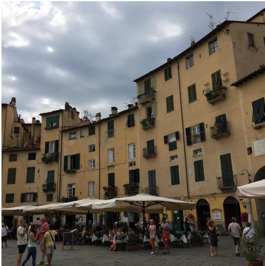
Piazza dell'Anfiteatro, Lucca, Toscana