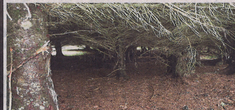
Naturmangfoldet får svi: Tett bestand av sitkagran gir dårlige lysforhold på bakken, og fører til en svært dårlig utviklet bunnvegetasjon.