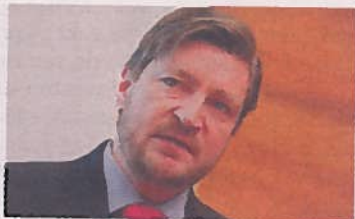
Stortingsrepresentant: Christian Tybring-Gjedde (Frp).