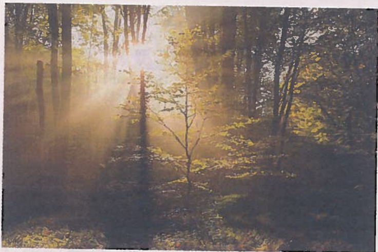
Grønt skifte: Skogen kan bidra mot klimakrisen, mener skognæringen. De jubler over at politikerne har kommet til samme konklusjon i den nylig fremlagte klimameldingen.

– Enkelte har ment det er et argument for å la skogen stå. Klimameldingen sier det motsatte. Et tre som bare står i skogen vil til slutt råtne, og da vil karbonet frigjøres. Nå har vi fått en enighet om at vi skal hogge før det skjer, sier Lahnstein.